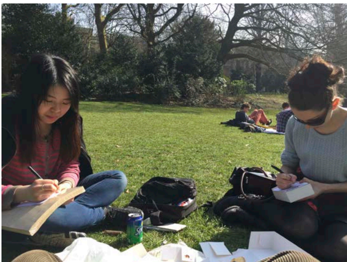
図 4：リールの公園で活動を行う C と I

Cの脚本制作過程においては、Iが当該テーマに対して、自国の文化圏について補足を加える場面があった。キリスト教徒にとって、パンはキリストの肉体の一部として考えられている重要な食材であり、だからどんなに固くなっても捨てることは無く、スープや飲み物に浸して柔らかくして食べるのであると説明した。Cはそれを知らなかったため、それまであまり好意的に思っていなかった、フランス人がパンを浸して食べるという文化に対して、理解を示したようであった。異文化間交流を促す仕組みとしての脚本校正の行程が、功を奏した場面であったと言えるだろう。