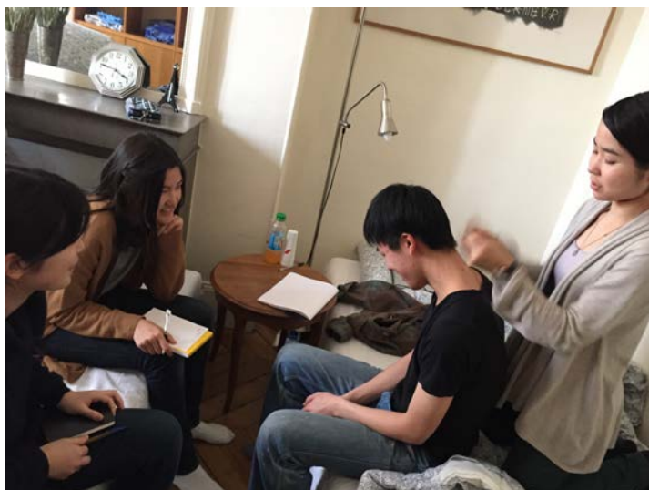
図 3：制作の合間に交流を深める日本側メンバー

このタンデムの参加者たちが設定した作品のテーマは、日本側が「フランスの店員の接客態度と同性愛について」、フランス側が「日本の会社での諸風景」である。どちらのグループの側にも、演劇経験者や映像制作に特化したメンバーがおり、作品の創作過程においては、彼らがリーダーシップをとって、グループを活性化し、撮影の際にもアングルや録音にこだわりを見せるなど、創作活動の面でもより本格的な実践になった。