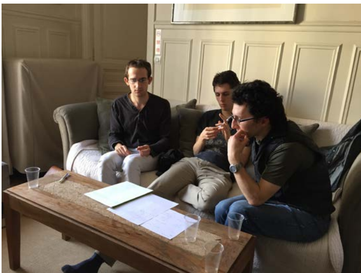
図 2 : 脚本の内容を話し合うフランス側メンバー

パリにおける活動実践の大きな特徴は、1対1の組み合わせではなく、参加者全員が日本側・フランス側に別れて一同に参加する形で、複数人グループ型のタンデムが形成された点にある。コーディネーターとしての筆者が当初想定していたのは、それぞれに1対1のコンビを形成してもらう形であったが、実際の活動の流れの中で、参加者たちから、全員参加型の形が望ましいとの意見があり、それを優先することにした。この決断をした理由は、私が、「自分の研究を進捗させる」という表層的な目的よりも、参加者たちにとって本当に意味のある活動をしてもらいたいという実践重視の志向を持っているからである。自らの研究に利する形の研究結果を求めるのであれば、全て統一した形式、つまり1対1の形式で全ての活動を行えば、後の分析・考察作業において比較検証する際により有効なデータとなるであろう。しかし、それは参加者たちを、私の研究の「モルモット」として活用するための形式でしかない。自分の研究に参加して手助けをしてくれる人たちにこそ、自らもまた意味のある活動をフィードバックすることが出来なければ、他者同士の交流からの学びを促す実践教育を志向する研究者としては失格であると考えている。だからこそ、参加者たちが自律的に構築しようとする学びの形を「整形」することなく、あくまでもそれを促進する(ファシリテートする)存在として、その場に関わっていく事が私にとっては肝要なのである。