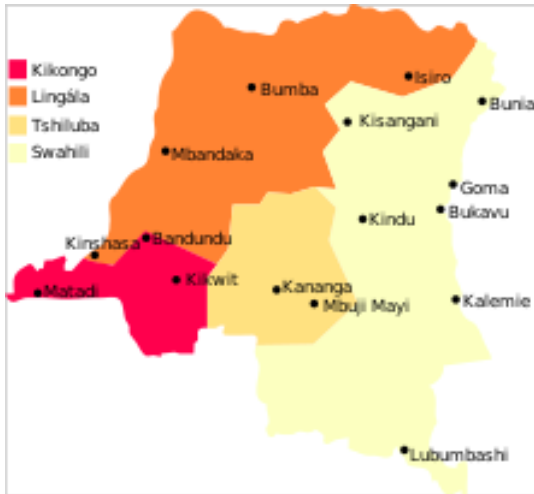
図2 コンゴ民主共和国 言語分布図